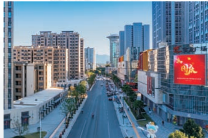
《永康解放路十年变迁》(组图)