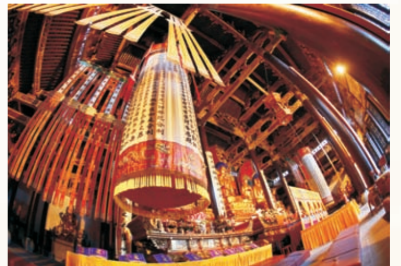
《慧云禅寺开光》