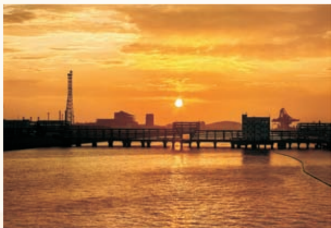
《侨乡夕阳》