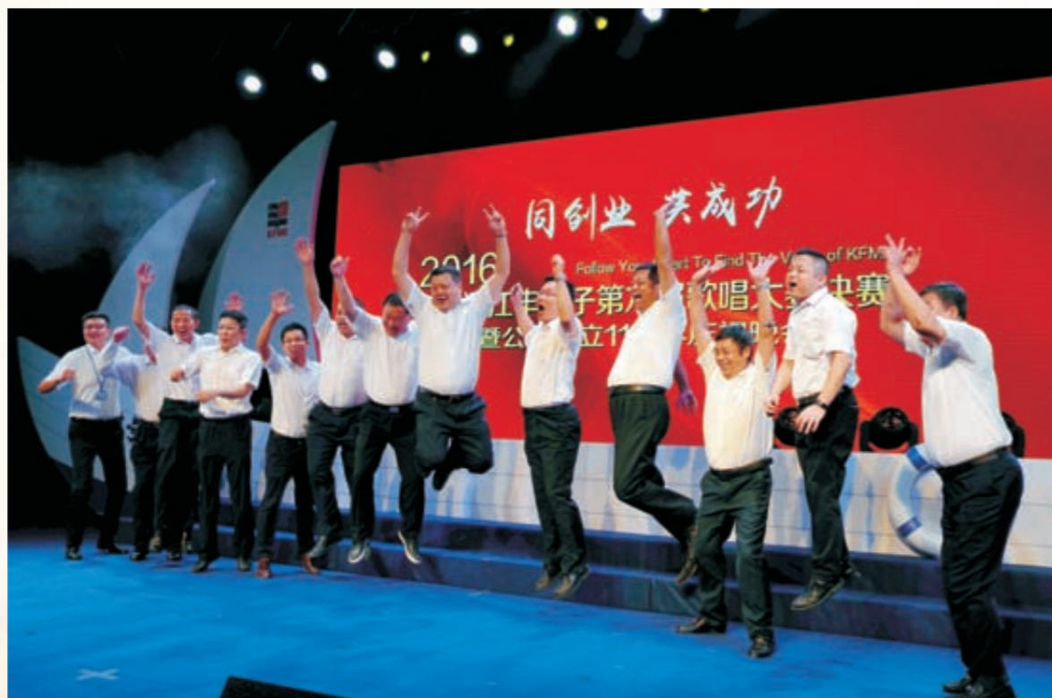
《江丰腾飞》(组图)