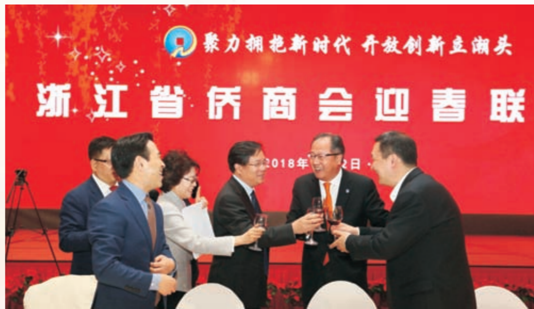
《共迎新春》