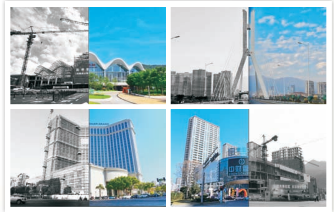
《侨乡蜕变》(组图)