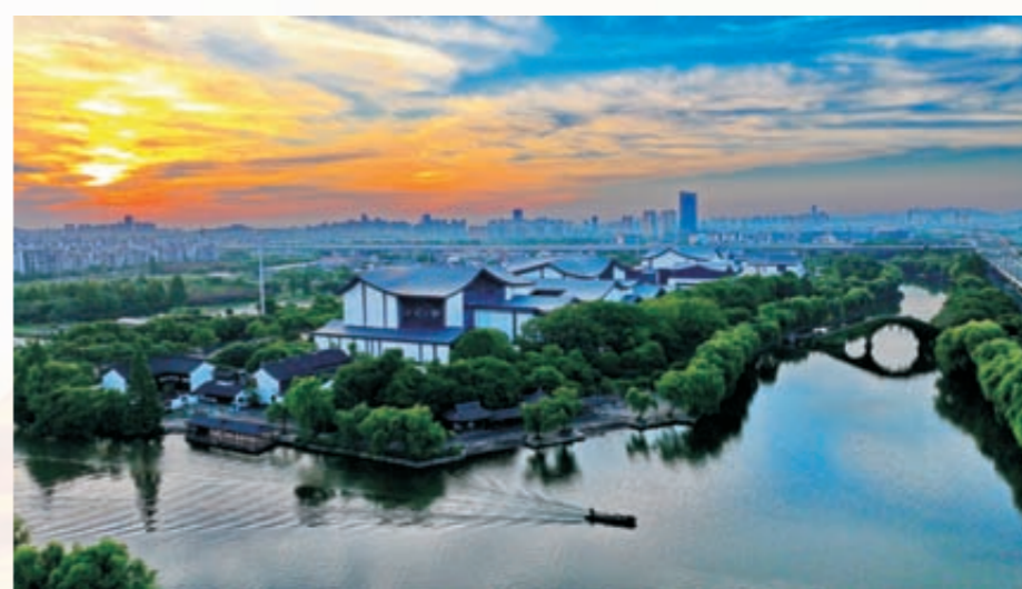
《绍兴新城》（组图）