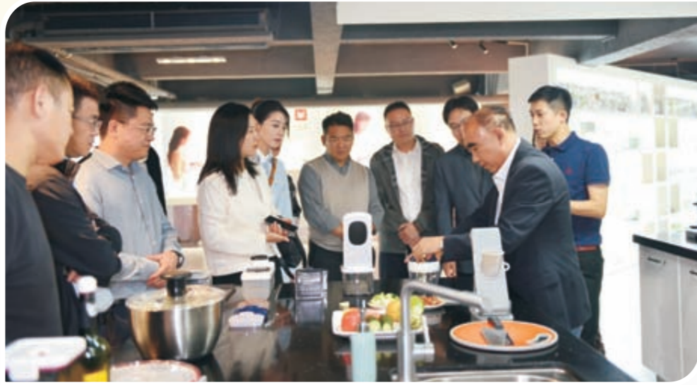
考察双马塑业有限公司