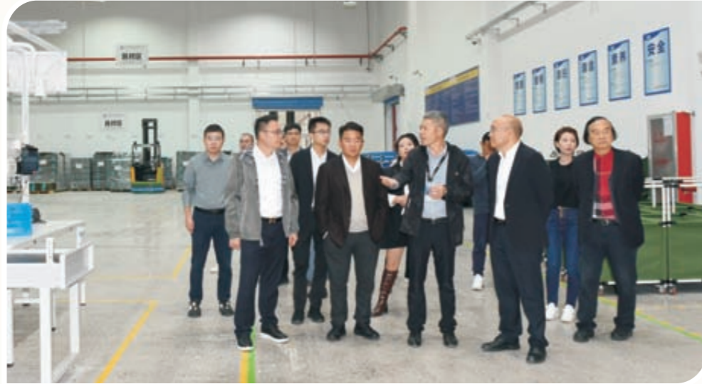
考察台州综合保税区