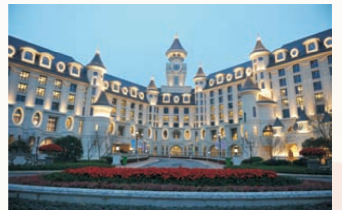
《2014凯蒂猫家园落成》（组图）