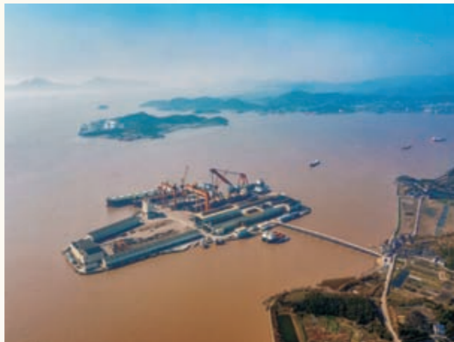
《半岛船业》