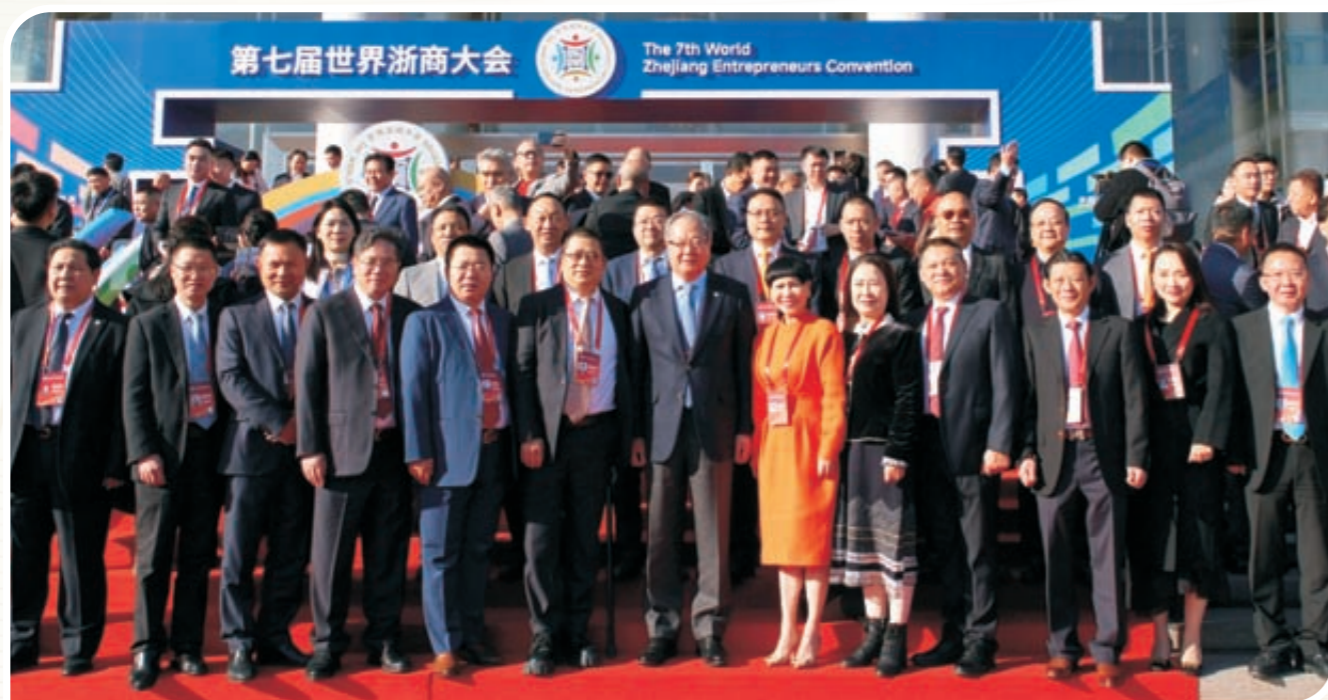
省侨商会部分代表合影