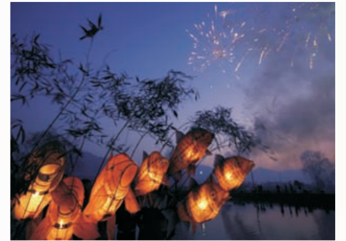
《浦江灯会》(组图)