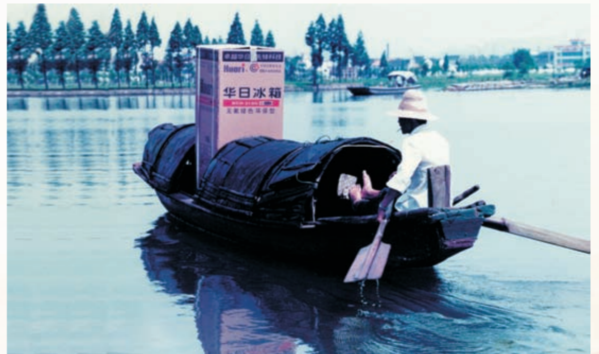
《“华日冰箱”下乡》