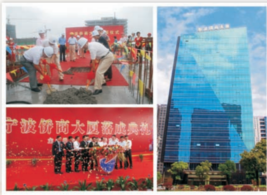
《全国侨商第一楼》(组图)