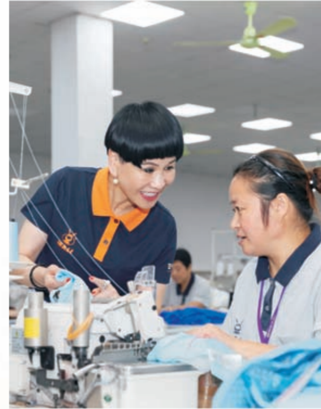
《倾情相授》