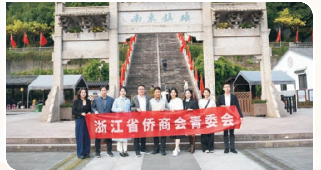
浙江省侨商会青委会