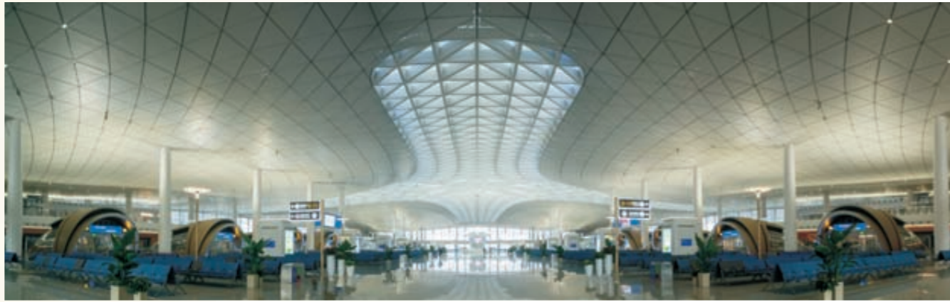
《车站新貌》