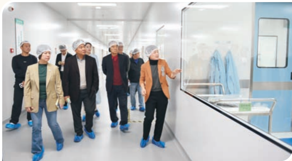
考察华海制药科技有限公司