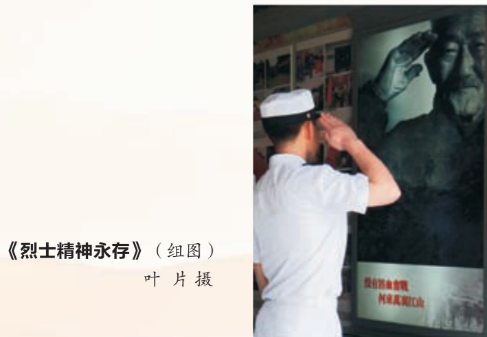
《烈士精神永存》 (组图)