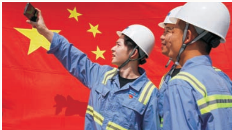
《我和祖国合张影》