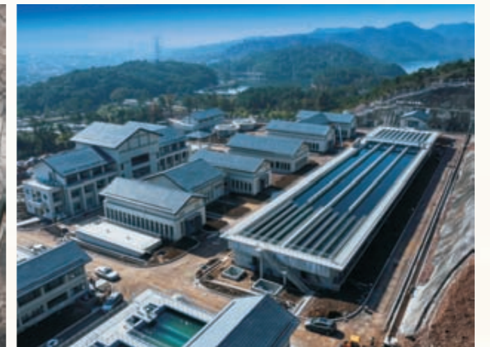
《造福于民》(组图)