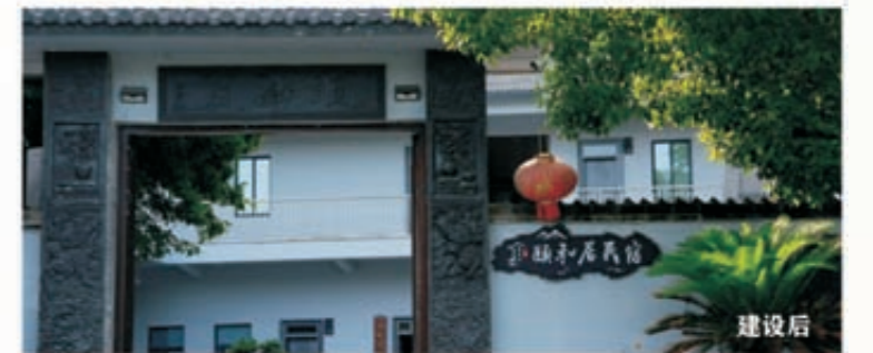
《共富的种子》 (组图)