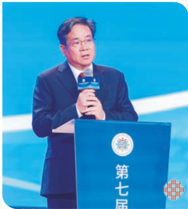
丁列明在论坛上作主题发言