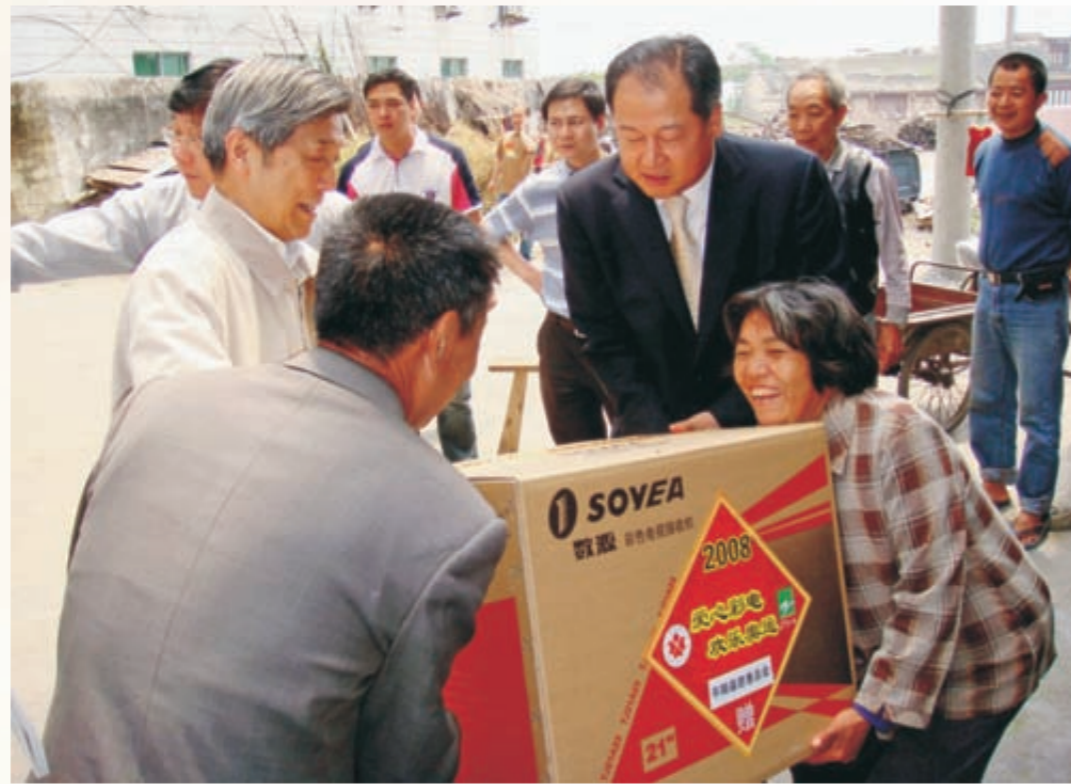
《奉献爱心》