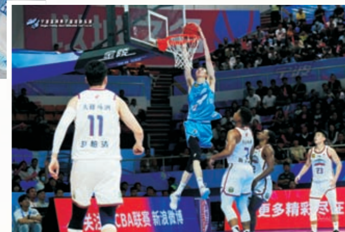
《富邦篮球俱乐部》(组图)