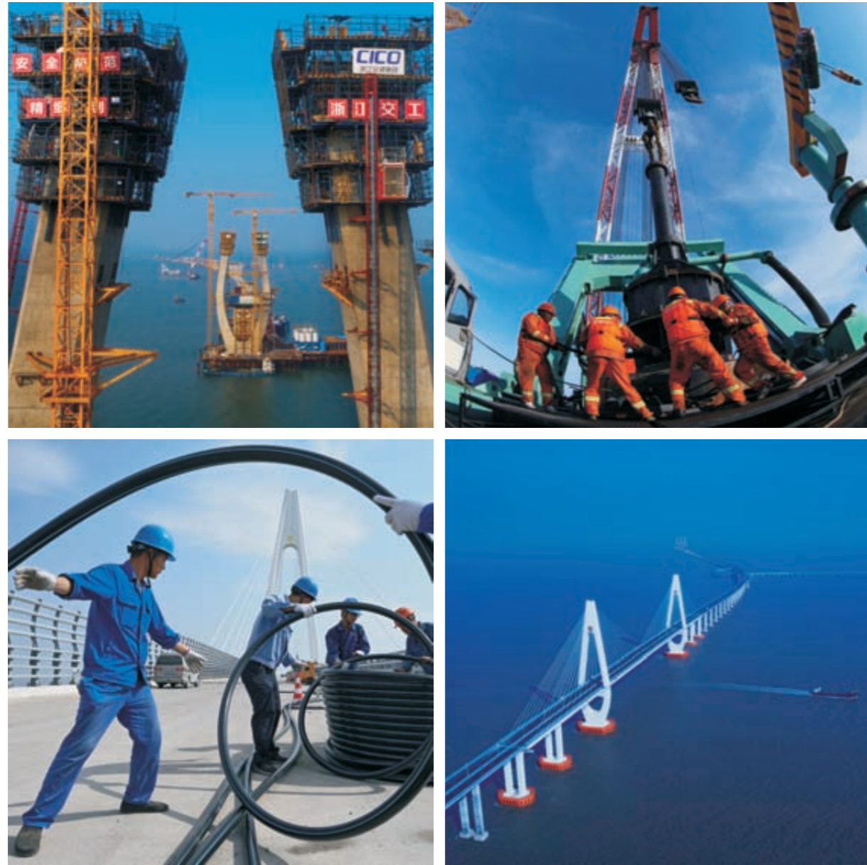
《天堑变通途》(组图)