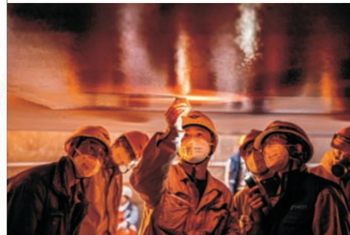
《精益求精》