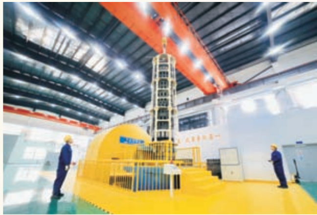
《国内最大热等静压机》