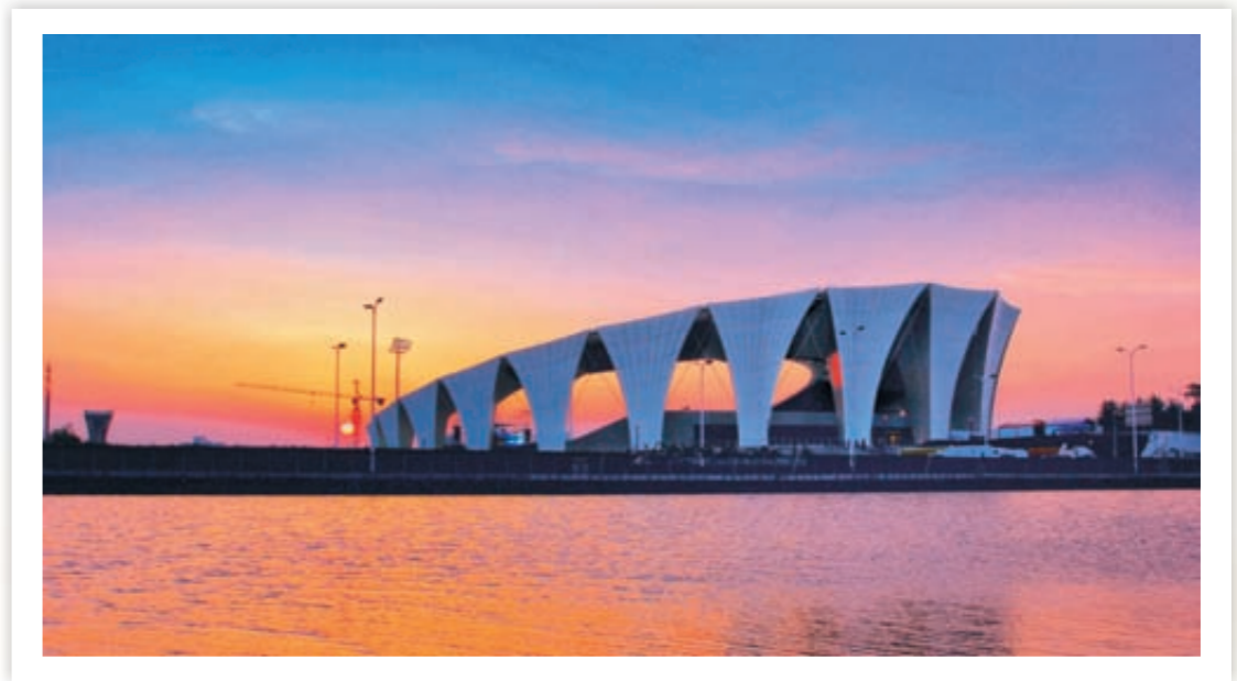
《东体初晓》