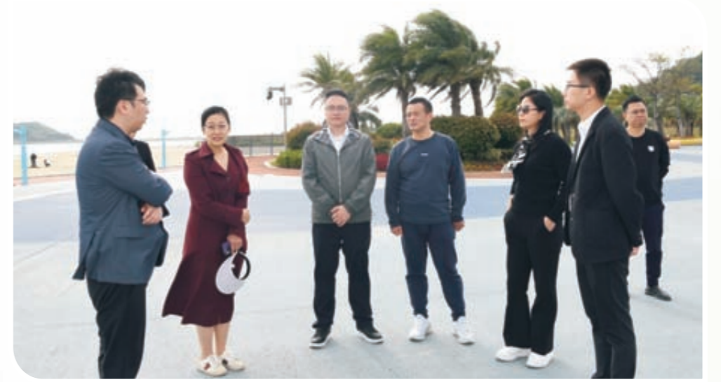
考察白沙湾滨海湿地生态修复项目