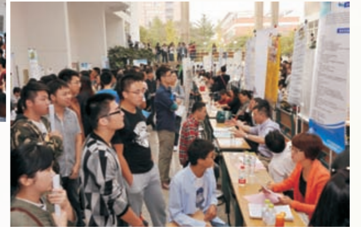
《侨企招聘会》（组图）