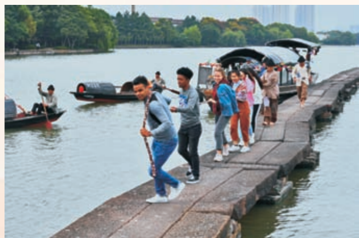
《洋学生体验绍兴古运河文化》（组图）